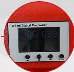
GY-06 Digital Controller C&F Read-out and Press Counter