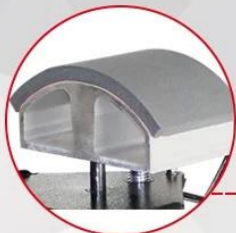
Easy cap mounting clamp