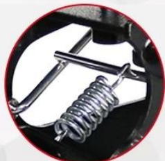
High quality accessories