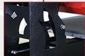
Double Gas Spring