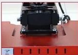
Anti-Scald Protect Cover