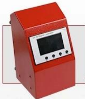
Changeable Electric Box For Easy Maintenance