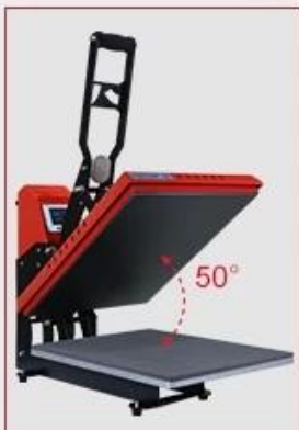
Wide Open Angle