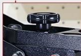
Adjustable Press Pressure