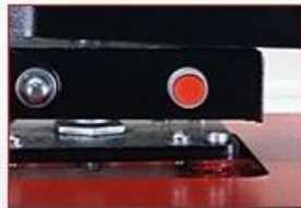
Manual Release Button For Emergency Issues

Auto Open Heat Press: TC-15/ TC-20 Size:15"x15"&16"x20"