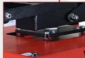
Pressure Balance Spring