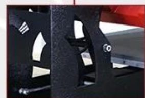
Double Gas Spring