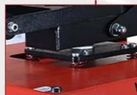
Pressure Balance Spring