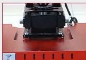
Anti-Scald Protect Cover