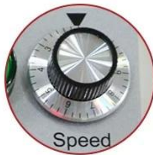
Speed Control Button