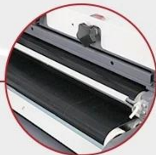
Upper and Lower Heating Rollers