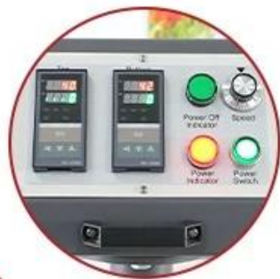
Movable REX-C400 Digital Controller

Continuous Transfer Printing Machine: OTO-24 Print Width: 60cm