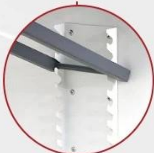
Infeed - Adjustable Table Inclination