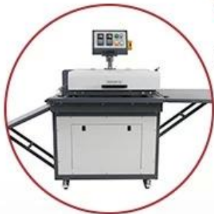
Outfeed - Adjustable Table Inclination