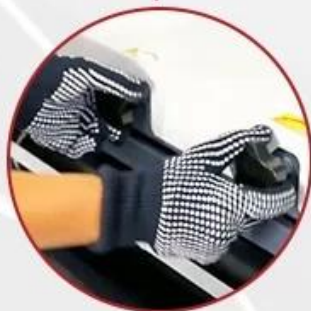
Adjustable Pressure Settings