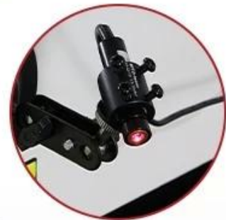
Infrared Positioning System