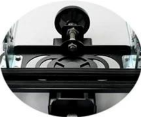
Sealing rubber strip