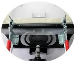
IT' s sealed tight when making the frame