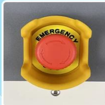
Emergency Stop Switch