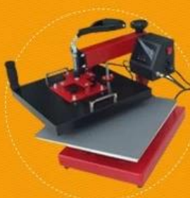
Digital Swing Away Heat Press Model No.: DCH-100