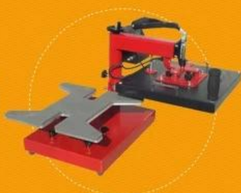
Shoe Heat Press Model No.: DCH-100-S