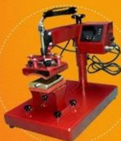
Curved Wine Pot Heat Press Model No.: DCH-100-W