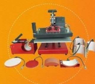
Digital Combo Heat Press Model No.: DCH-800