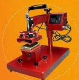
Curved Wine Pot Heat Press Model No.: DCH-100-W