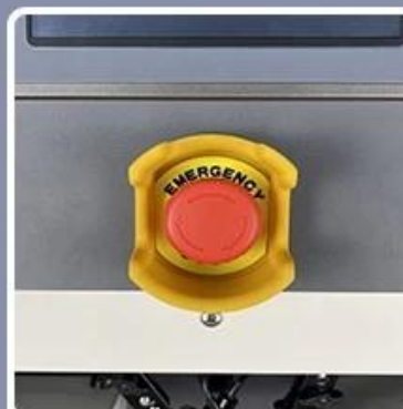
Emergency Stop Switch