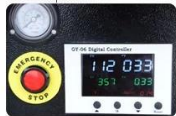
GY-06 Digital Time & Temp. Control