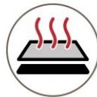
Even Heat Even Pressure