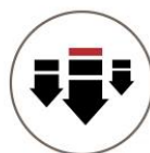
High Pressure Application