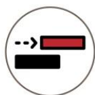
Slide-out for Easy Use