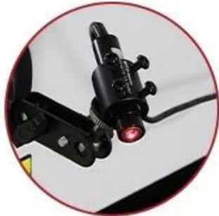
Infrared Positioning System