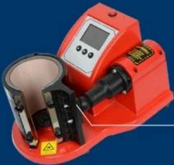
MP-99 Digital Mug Press