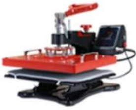
T-shirt Heat Press