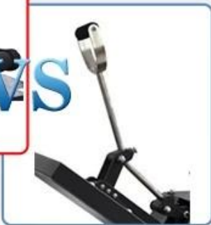
Normal metal handle, easy to break