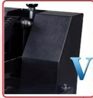
Iron electric box, stronger housing