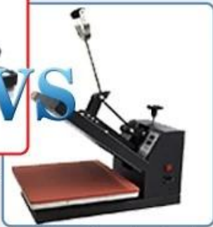
Simple and weak structure with lower pressure