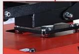
Pressure Balance Spring