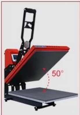
Wide Open Angle