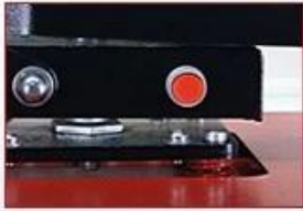
Manual Release Button For Emergency Issues

Auto Open Heat Press: TC-15/ TC-20 Size: 15"x15" & 16"x20"