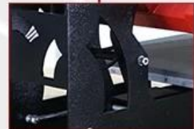
Double Gas Spring