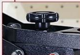
Adjustable Press Pressure