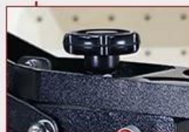
Adjustable Press Pressure