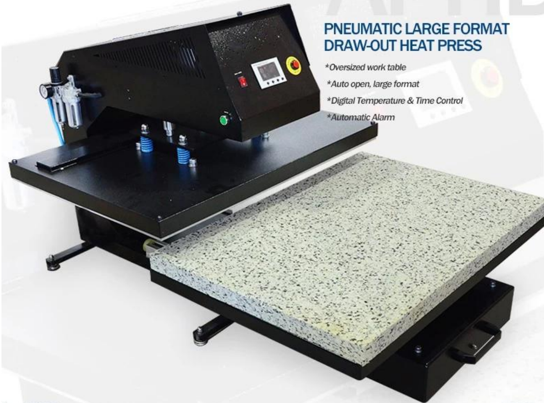
GY-06 Digital Time & Temp. Control