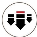
High Pressure Application