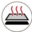
Even Heat Even Pressure