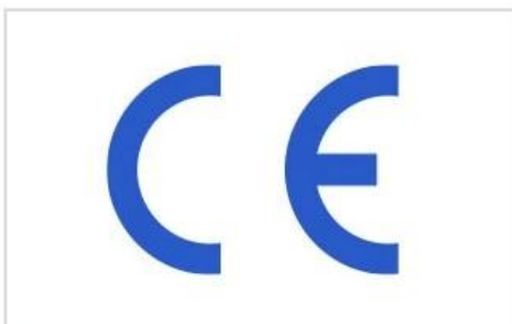
7 CE Certified & Strict Quality Control Before Packing