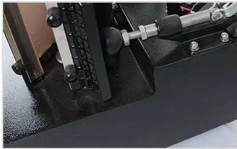
1 Solid and Durable Welded Frame

Microtec 5-in-1 mug printing machine is specifically designed for batch production, allowing you to print on 5 mugs measuring 7-9cm in diameter simultaneously. This efficient and functional mug press ensures even heating and bring excellent printing effect.