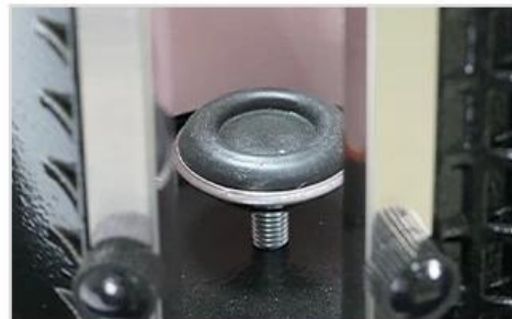
6 Adjustable Base for Different Mug Height