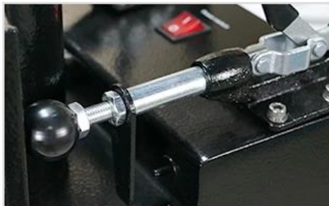
3 Easy-operated Pressure Adjustable Knob