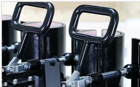
5 User-friendly Ring Shaped Handlebar Grip