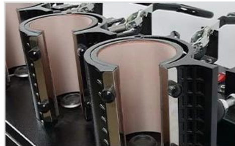
4 Strong Mug Wrap for Different Size Mugs