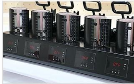
2 5 Individual Digital Control System