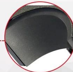
Baked with Teflon coating