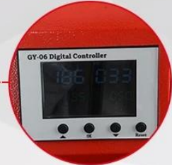
GY-06 Digital Controller C&F Read-out and Press Counter