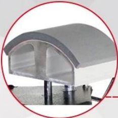
Easy cap mounting clamp