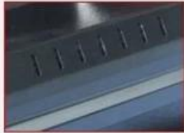
Anti-Scald Protect Cover