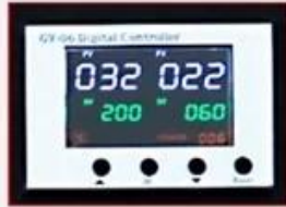
GY-06 Digital Controller