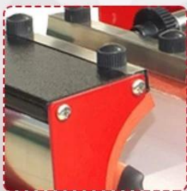
Four Hand Screw--Easy Operation