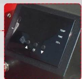
GY-04 Digital Time & Temperature Controller