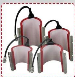
4 size mug heater for option