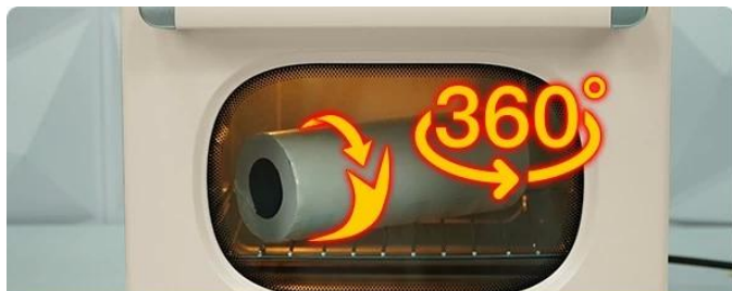
Even Heat Circulation