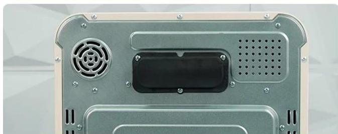
Efficient Heat Dissipation