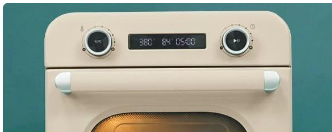
Smart Precise Control