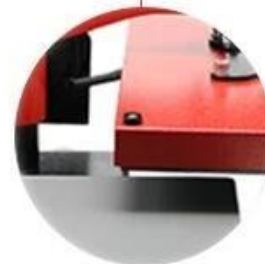
Swing Away Design: Safe easy to use, and better pressure