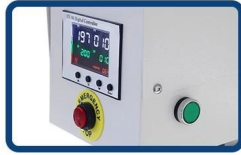
GY-06 Digital Time & Temp. Control Safe start button and emergency stop button