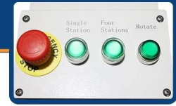
Each station can be operated independently 4 stations rotate fully automatic