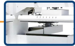
4 working stations