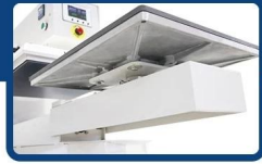
Exchangeable under plate