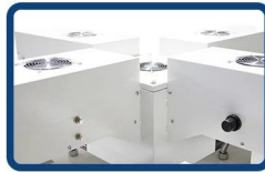
Cooling fans to dissipate heat