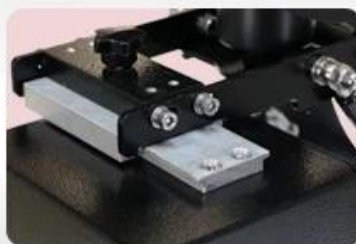
Quick Slide-out Heat Platens