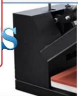
Normal plastic housing, easy to break during the shipping