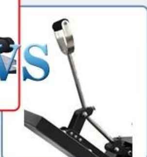
Normal metal handle, easy to break