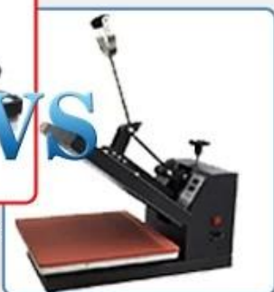
Simple and weak structure with lower pressure