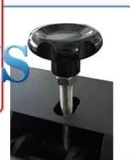
Simple vertical chassis