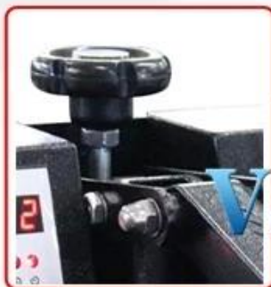
Stronger iron vertical chassis & Adjustable Press Pressure