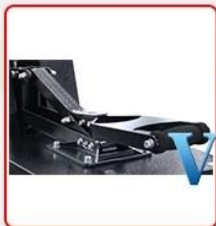
Stronger iron handle