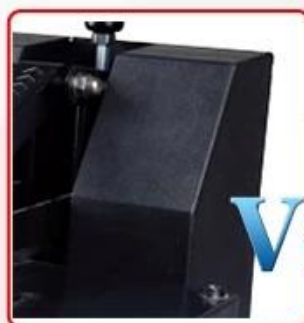
Iron electric box, stronger housing