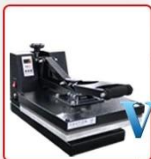
Stronger structure with high pressure