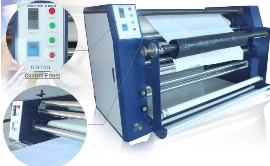
Front Portion of Machine's Left Cabinet

Available Printing Width: 1.7m(67")/2.5m(98")/ 3.2m(126") Model No.: RTR-1700/RTR-2500/RTR-3200