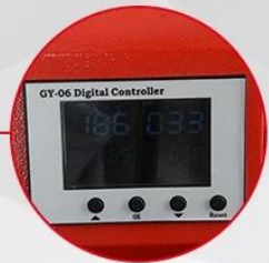
GY-06 Digital Controller C&F Read-out and Press Counter