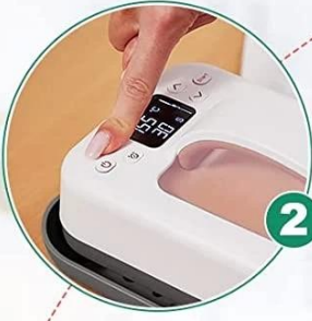
2 Set Time And Temperature