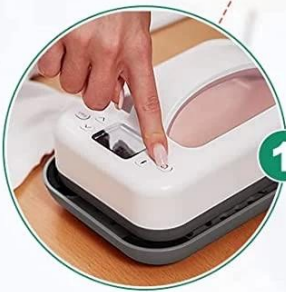
1 Turn On The Switch