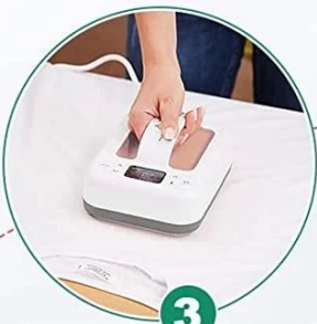
3 Start Transfer