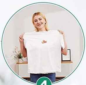
4 Transfer Completed