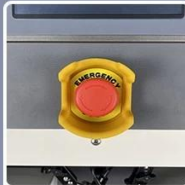
Emergency Stop Switch