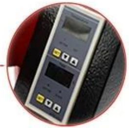
Vertical Digital Controller: Accurate in time and temp. display