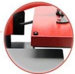
Swing Away Design: Safe easy to use, and better pressure