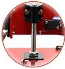
Limited Rod: Stand still, more safty