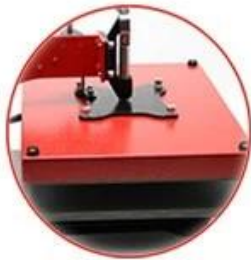
12"*15" Size: Popular size and versatile