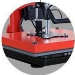
12**15" Size: Popular size and versatile