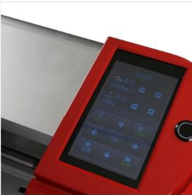
Large LCD touch screen