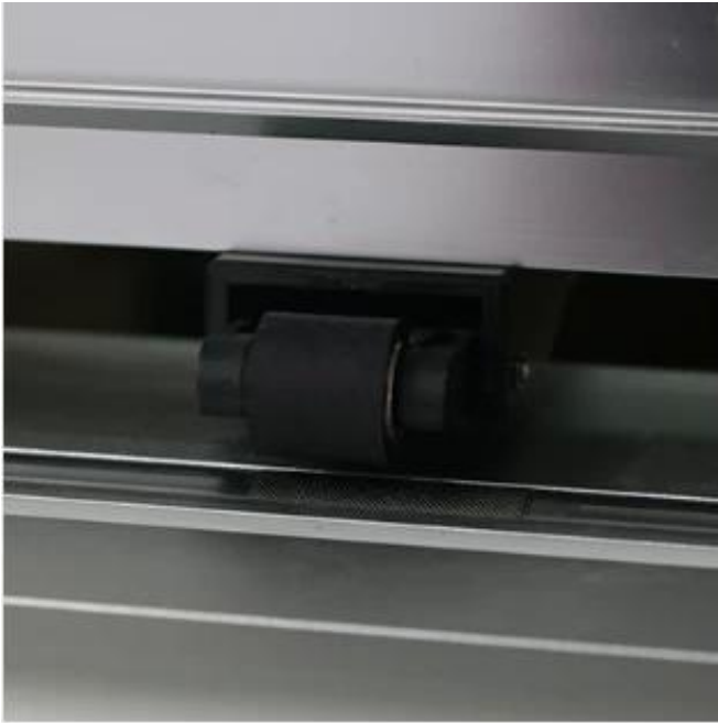
one-in-all barbed steel high cutting accuracy