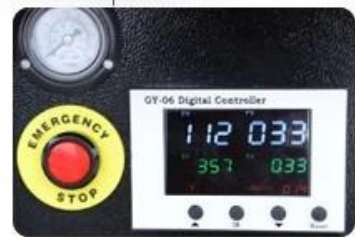
GY-06 Digital Time & Temp. Control