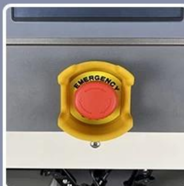
Emergency Stop Switch