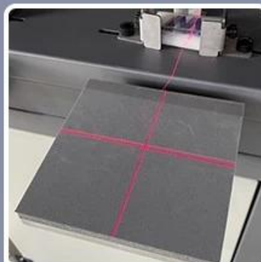
Precise positioning function