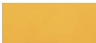
MY306 Medium Yellow