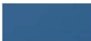
LB315 Light Blue