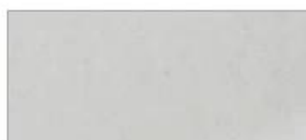
PR321 Purple Royal