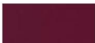
PK325 Fuchsia Pink