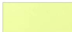
NY312 Neon Yellow