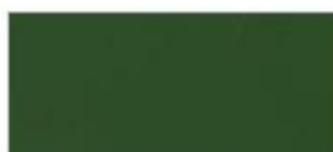
AG326 Apple Green