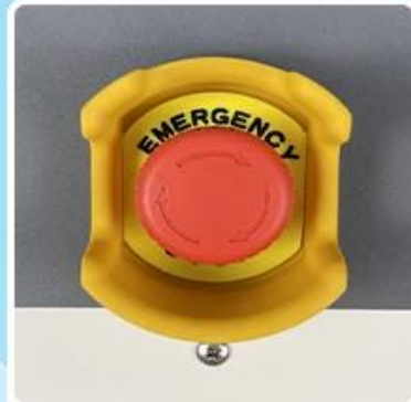
Emergency Stop Switch