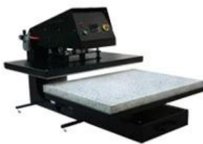
Pneumatic Large Format Draw-out Heat Press Item No.: APHD-40 Heat Platen Size: 75x105cm