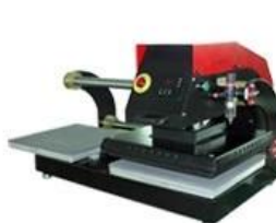
Pneumatic Double Location Shuttle Heat Press Item No.: APDS-15/20 Heat Platen Size: 38x38/40x50cm