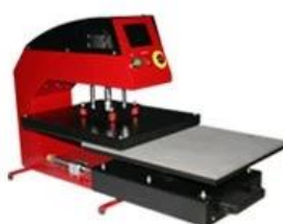
Pneumatic High Pressure Draw-out Heat Press Item No.: APD-20/24 Heat Platen Size: 40x50/40x60cm