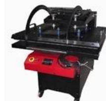
Semi-automatic Manual Large Heat Press Item No.: STM Heat Platen Size: 60x80cm, 80x100cm, 100x120cm, 100x140cm