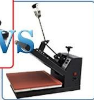
Simple and weak structure with lower pressure