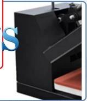
Normal plastic housing, easy to break during the shipping