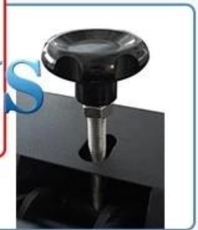
Simple vertical chassis