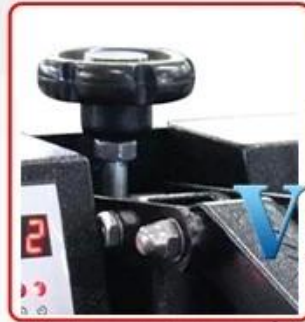
Stronger iron vertical chassis & Adjustable Press Pressure