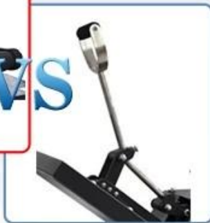
Normal metal handle, easy to break