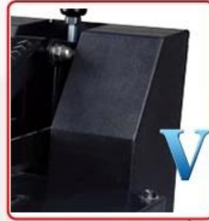
Iron electric box, stronger housing