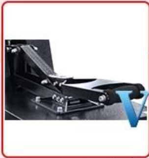
Stronger iron handle