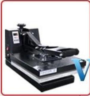
Stronger structure with high pressure