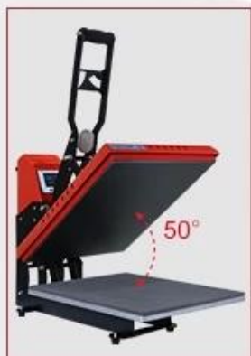
Wide Open Angle