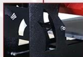
Double Gas Spring