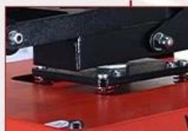
Pressure Balance Spring