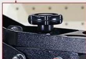
Adjustable Press Pressure