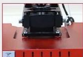
Anti-Scald Protect Cover