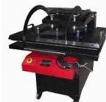
Semi-automatic Manual Large Heat Press Item No.: STM Heat Platen Size: 60x80cm, 80x100cm, 100x120cm, 100x140cm