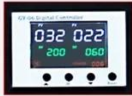
GY-06 Digital Controller