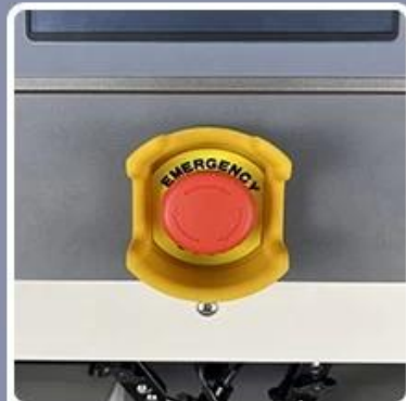
Emergency Stop Switch