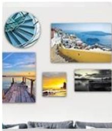
Εκτυπώσεις μετάλλων HD

Αυτό το μηχάνημα αυτόματης πρέσας με πλήρη αυτόματη θερμότητα με ηλεκτρική ενέργεια είναι κατάλληλο για οποιοδήποτε εξάχνιμο ή μεταφερόμενο προϊόν. Για παράδειγμα: μπλουζάκια, κορνίζες φωτογραφιών, παντόφλες, mouse pads, αθλητικά είδη και άλλα επίπεδα προϊόντα.