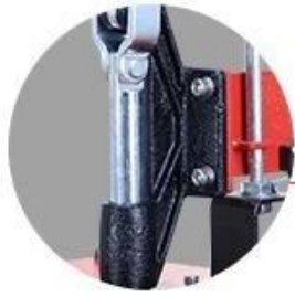
Limited Rod: Stand still, more safty