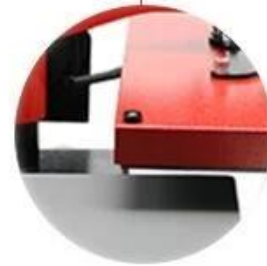
Swing Away Design: Safe easy to use, and better pressure