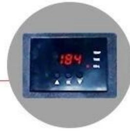
GY-04 Digital Controller: Accurate in time and temp. display