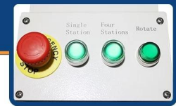
Each station can be operated independently 4 stations rotate fully automatic