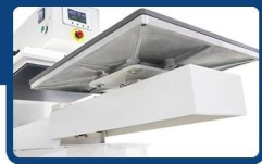
Exchangeable under plate