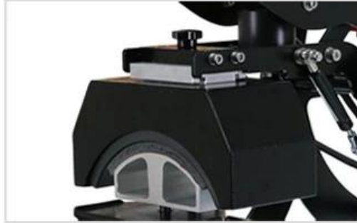
2 Slide-out Hat Platen