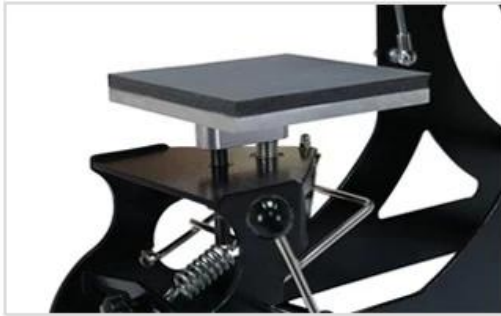
3 Quick-change 15x15cm Under Plate