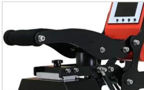
6 Strong Durable Machine Metal Frame