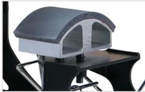
4 Quick-change Hat Under Plate