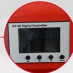
GY-06 Digital Controller C&F Read-out and Press Counter