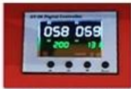
GY-06 Digital Time & Temp. Control