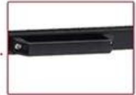
Draw-out Under Plate