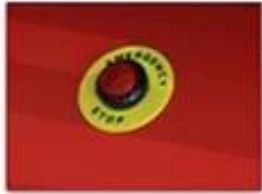
Emergency Stop Switch