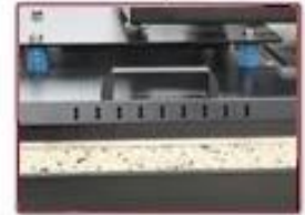
Anti-scald Protection Metal Cover