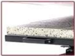
Recycled Cotton Pad